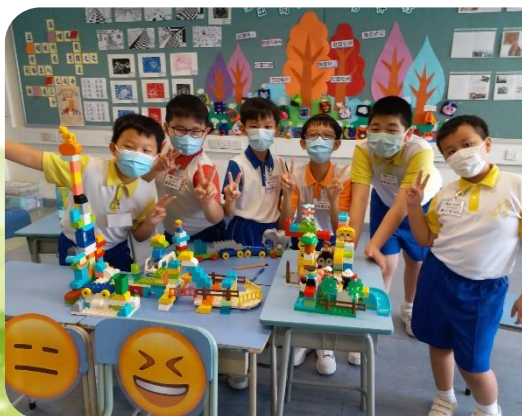
服務學習：小領袖培訓