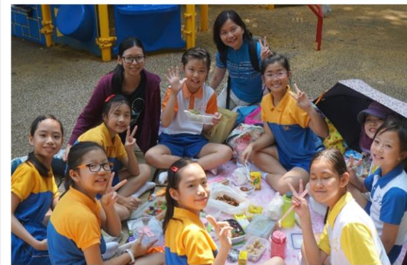
學校旅行暨競技日