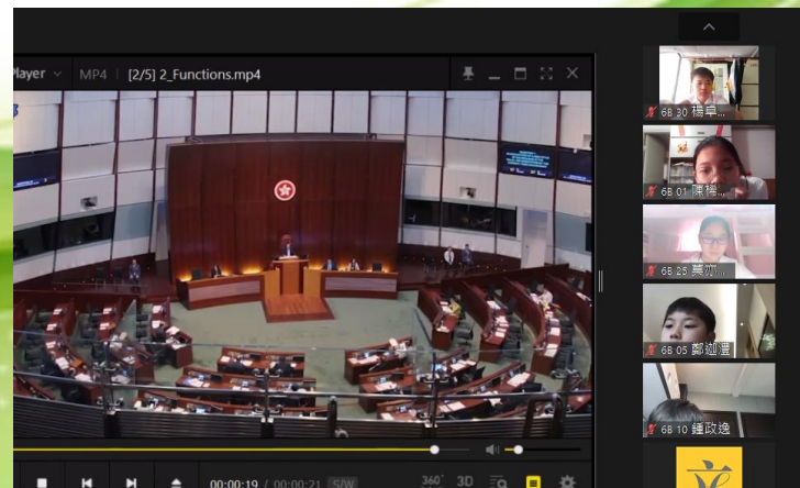
網上參觀立法會綜合大樓