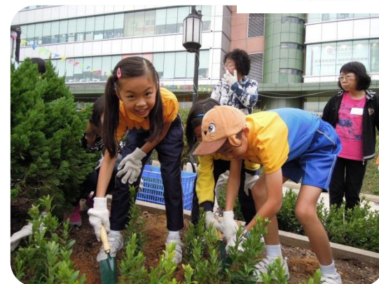
葵青綠化植樹活動