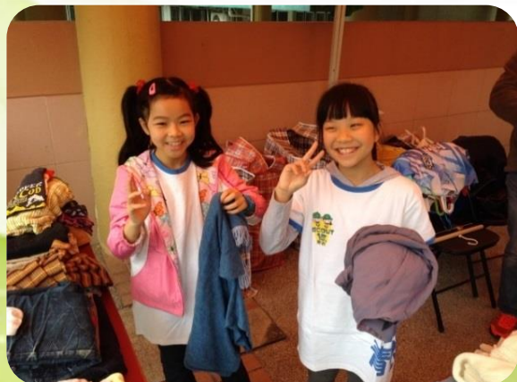
幼童軍參與環保服務