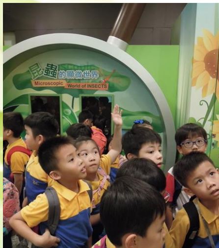
獅子會自然教育中心