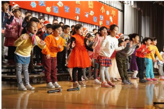
聖誕友愛同樂才藝表演